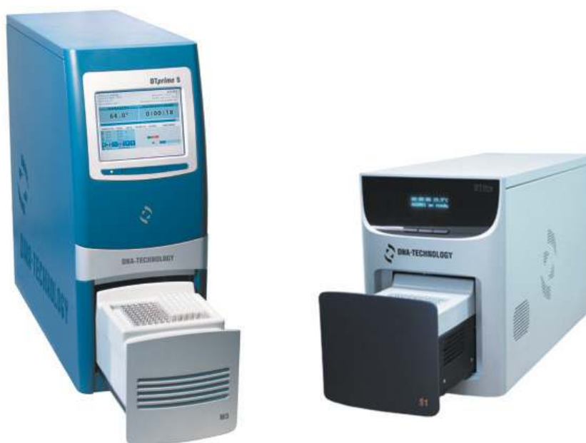
Рис. 1. Приборы производства компании «ДНК-Технология»

Уникальные технические характеристики приборов позволяют существенно сократить общее время проведения анализа. Это значительно экономит время исследования и обеспечивает высокую пропускную способность лаборатории.